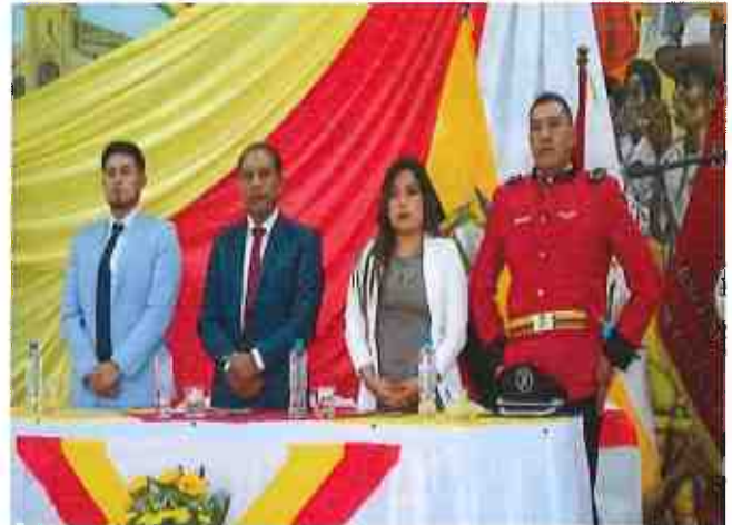
Anexo 2.- Himno Nacional