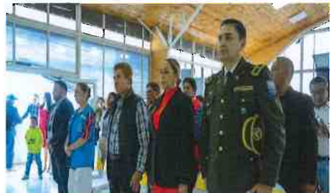
Anexo 5.- Himno al cantón Bolívar