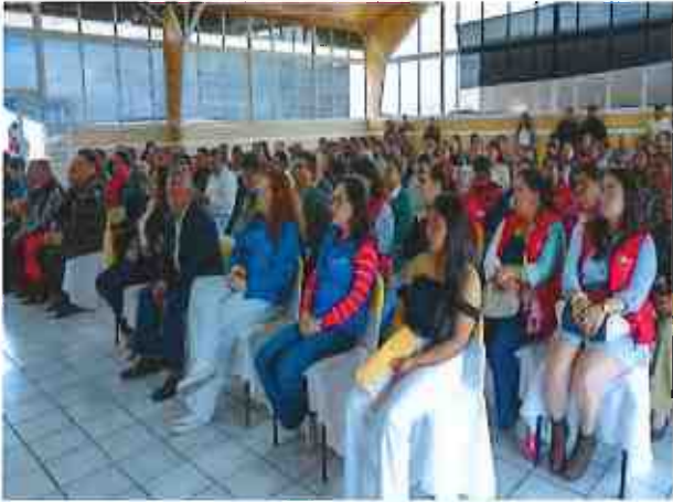
Anexo 1.- Fotografía asistentes